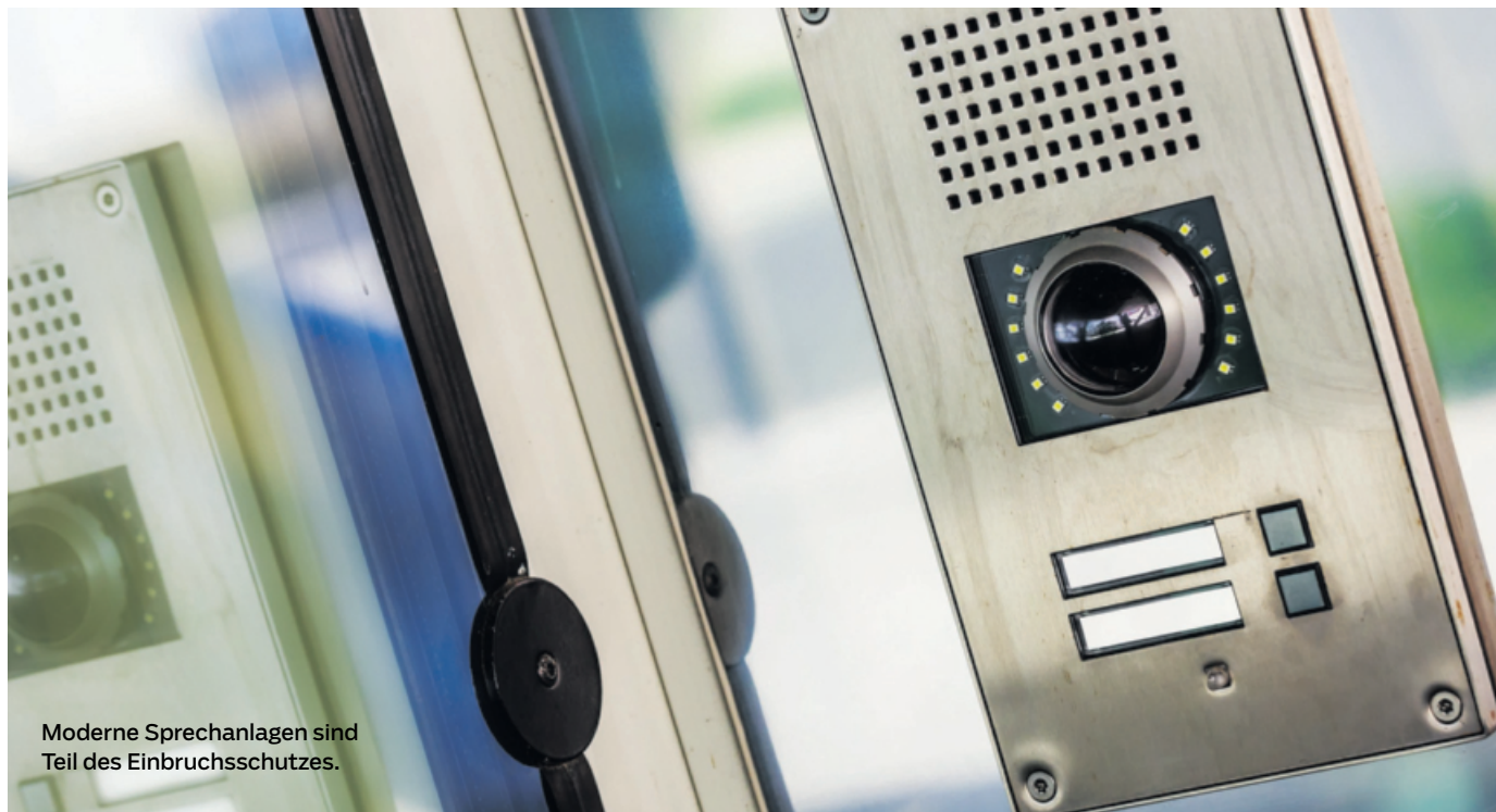
Moderne Sprechanlagen sind Teil des Einbruchsschutzes.